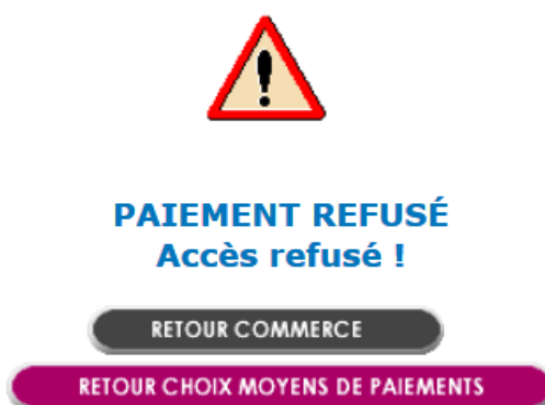
Figure 3 : Tentative de création d'abonné, fenêtre d'erreur

Concrètement, cela signifie que lors de l'accès à la page de paiement Limonetik, Verifone refusera une tentative de paiement si la valeur U est présente dans le champ PBX_RETOUR.