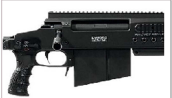
Swiss Arms SAN 511 Päzisionsgewehr, Kaliber .50BMG / 12.7 x 99 mm